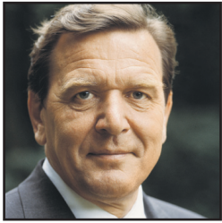
Bundeskanzler a. D. Gerhard Schröder über pfiv:

„Viele Gründe sprechen dafür, dass Betriebe selbst ausbilden. Kleine oder neu gegründete oder hoch spezialisierte Betriebe können jedoch oft nicht alle Ausbildungsinhalte anbieten. Da sind Ausbildungsverbände eine wertvolle Unterstützung.“